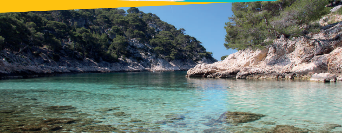
Tête du Chien