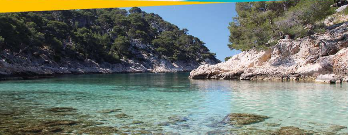
Tête du Chien